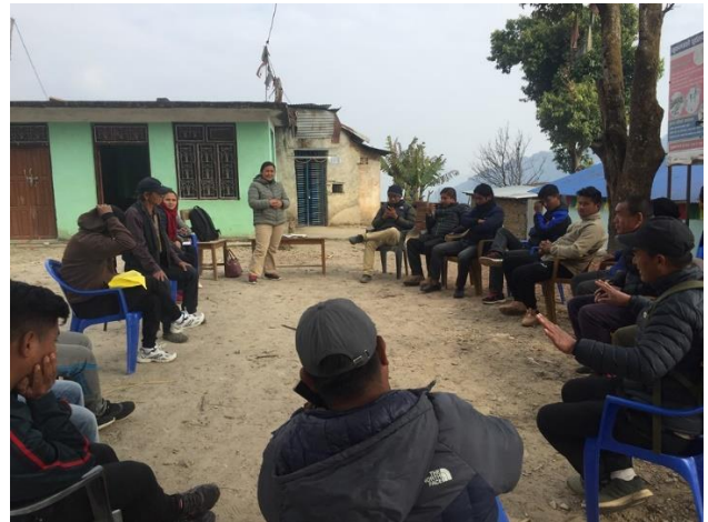
तस्बिर ४. ल क्षत समुह छलफल वडा न.२. बुम्ताड