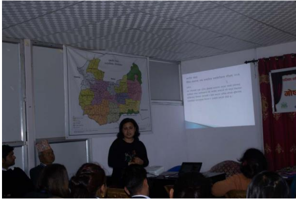
तस्बिर १. लैंससासको कार्यशाला गोष्ठी सम्बन्धि