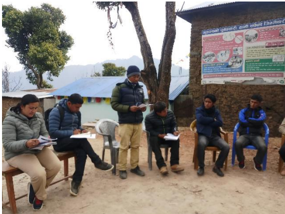
तस्बिर ३. ल क्षत समुह छलफल वडा न.२. बुम्ताड