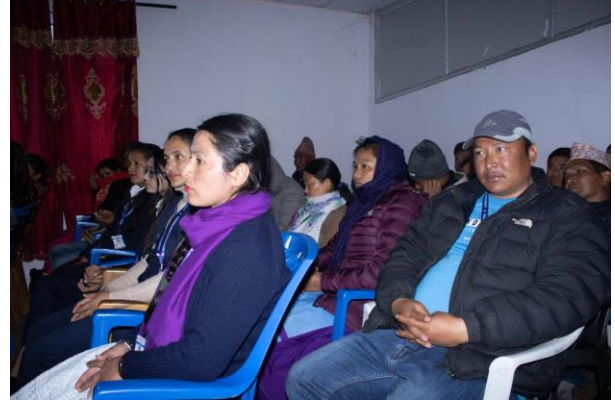
तस्बिर २. लैंससासको कार्यशाला गोष्ठी सम्बन्धि